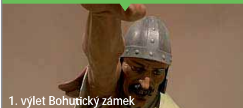
1. výlet Bohutický zámek